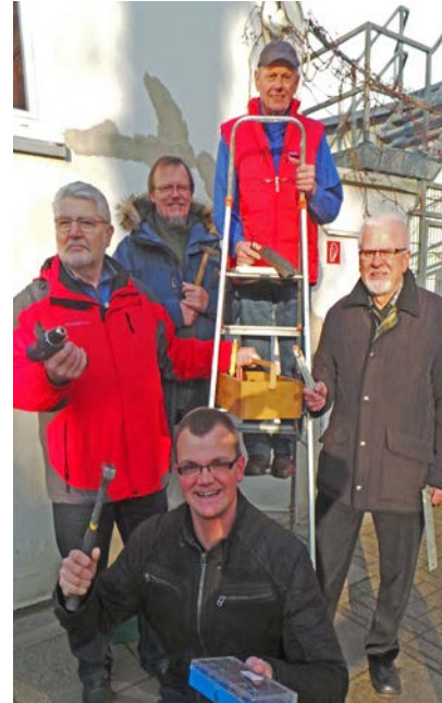
Heimwerkerdienst für Senior*innen 2007