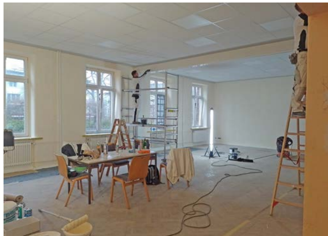
Umbau AWO Treff Vorwerk-Falkenfeld 2022

Die Hansestadt Lübeck schließt mit dem Kreisverband einen Budgetvertrag zur Finanzierung des AWO Quartiersprojektes für 5 Jahre.