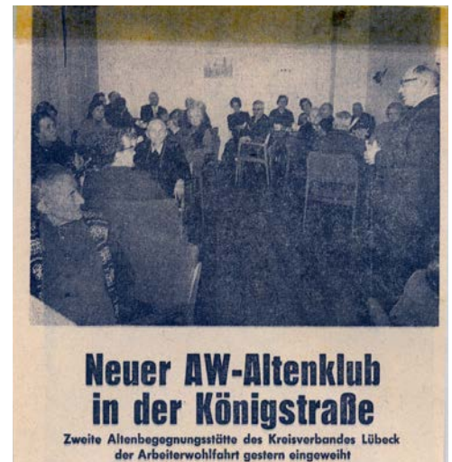
Eröffnung des AW-Altenklubs 1964

Die AWO Altentreffs Königstraße und Eichholz und der Altenclub Rangenberg werden eröffnet.