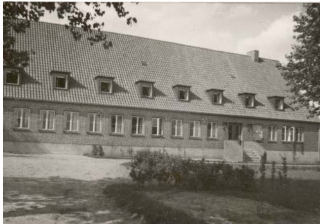
Lehrlingswohnheim Strecknitz 1951

Die AWO errichtet im Reetweg ein Lehrlingswohnheim mit 60 Plätzen.