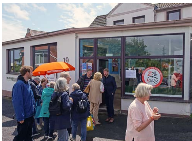
AWO Kinder- und Jugendtreff Zollhaus 2024