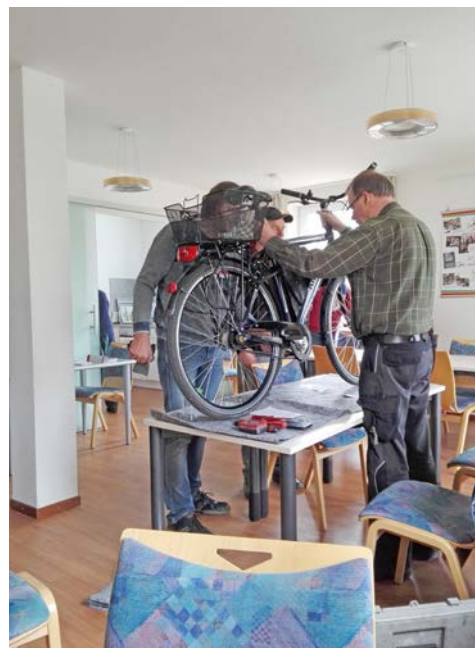
1. AWO Reparatur-Cafe 2016

Das 1. AWO Reparatur-Café findet im AWO Treff im Bürgerhaus Vorwerk-Falkenfeld statt.