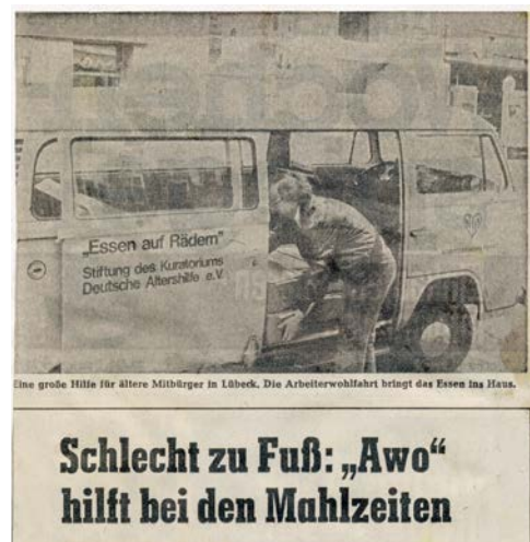
Mahlzeitendienst "Essen auf Rädern" 1970

Die Altentagesstätte Marli wird eröffnet.