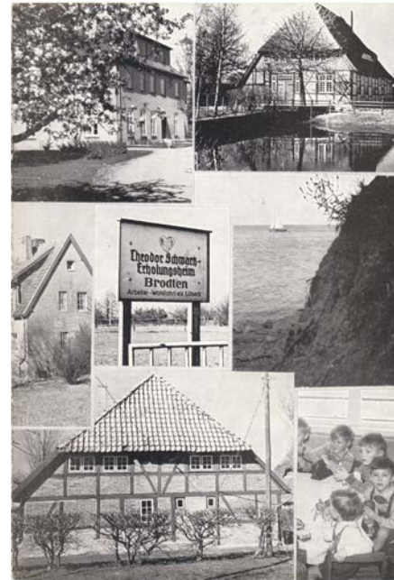
Einladung - 30 Jahre Theodor-Schwartz-Heim

Ersterwähnung der Arbeitsgemeinschaft der Freien Wohlfahrtsverbände Lübeck (Mitglieder: AWO, ev. Hilfswerk, Caritas, DRK, Paritätischer Wohlfahrtsverband, jüdische Wohlfahrtsorganisation).