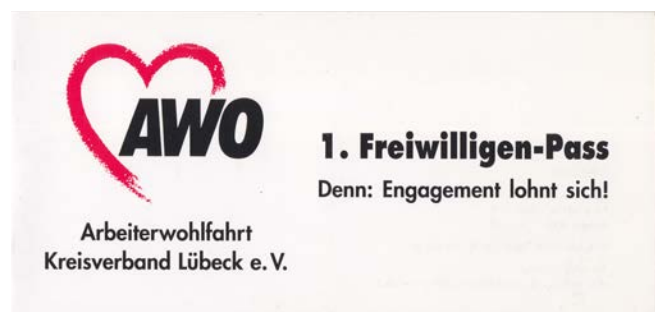
1. Lübecker Freiwilligen-Pass 2001

Der 1. Lübecker Freiwilligen-Pass der AWO wird entwickelt und an Ehrenamtliche verteilt. Er ist Ausdruck der Wertschätzung und Anerkennung der Arbeit der Ehrenamtlichen.