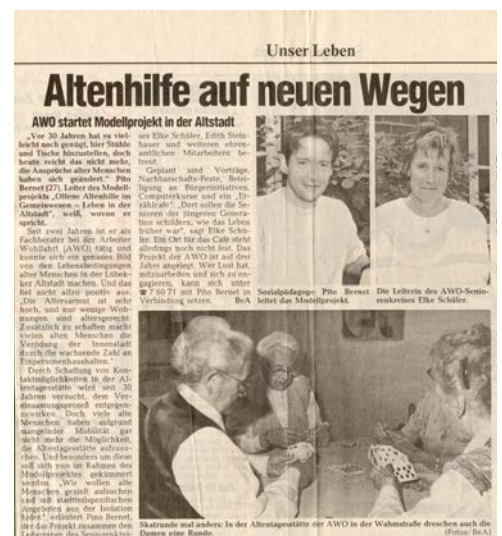
Fachberatung Offene Altenhilfe 1993

Der Kreisverband gibt die jeweils 4 DIN A 4 - Seiten umfassende Mitgliederzeitung "AWO am Ort" heraus. Sie wird an alle AWO-Mitglieder verschickt.