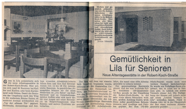
Eröffnung der Altentagesstätte 1976

Start der Stadtranderholung für Senioren (später: Reisen ohne Koffer), Gemeinschaftsprojekt der Arbeitsgemeinschaft der Freien Wohlfahrtsverbände Lübeck mit den Organisationen Caritas-Verband Lübeck e.V., Diakonisches Werk (später: Vorwerker Diakonie) und der AWO, Kreisverband Lübeck e.V..