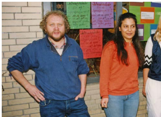
Kinder- und Jugendeinrichtung "Der Laden" 1979