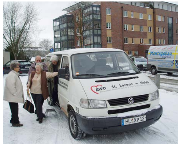
ehrenamtlicher Fahrdienst 1997

Er bietet älteren Menschen die Möglichkeit, zu den Seniorentreffs zu kommen, aber auch an anderen Veranstaltungen und Ausflügen teilzunehmen. Die Mitgliederzeitung "AWO am Ort" wird nach 9 Ausgaben eingestellt.