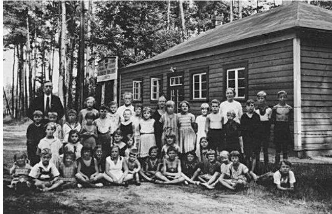
Milchkolonie in Schlutup 1932 mit 45 Kindern und 3 Mitarbeitenden

Der Lübecker Volksbote veröffentlicht einen Bericht über die Milchkolonie der Arbeiterwohlfahrt im Lauerholz in Schlutup und beschreibt ausführlich den Tagesablauf der 40 bis 45 Arbeiterkinder, die täglich mit der Straßenbahn vom Geibelplatz aus nach Schlutup fahren und am frühen Abend ebenfalls mit der Straßenbahn nach Lübeck zurückgebracht werden.