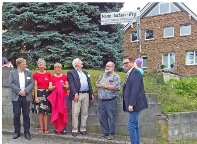
100 Jahre AWO 2019

Der Kreisverband initiiert zum Jubiläum unter anderem eine Veranstaltung im Marie-Juchacz-Weg. Im Rahmen eines Straßenfestes wird das Straßenschild um eine Erläuterung zum Leben und Wirken von Marie Juchacz ergänzt.