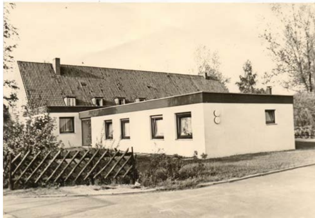
Anbau im Kinderheim Strecknitz 1969

Der Anbau im Kinderheim Strecknitz wird fertiggestellt (Lehrlingswohnheim). Dieses Haus wurde geschaffen, um den bisher notwendigen Wechsel der Jugendlichen in andere Einrichtungen zu vermeiden. Es gab 12 Plätze in 1- und 2-Bettzimmern.