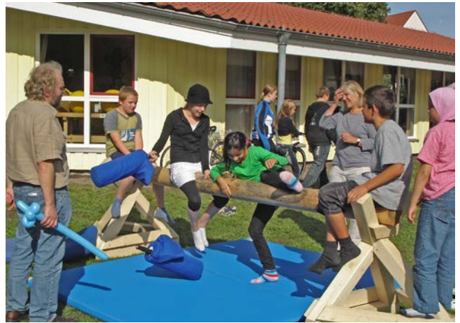
Kinder- und Jugendeinrichtung "Der Laden" 2003

Der AWO Seniorentreff Robert-Koch-Straße nutzt jetzt einen Mehrzweckraum in der Kita. Dies soll auch generationsübergreifende Projekte ermöglichen.