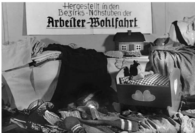
Kleiderausgabestelle der AWO Lübeck 1929

In seiner im Lübecker Volksboten veröffentlichten Jahresbilanz für 1928 berichtet der Ortsausschuss ausführlich über die Ergebnisse und Erfolge, die sich aus der Arbeit der in der Nähstube ehrenamtlich tätigen Frauen ergeben haben.